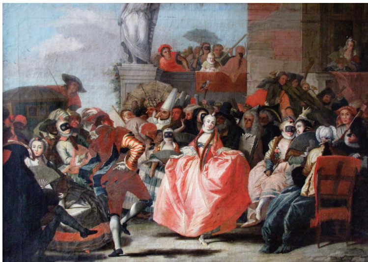
Scène de carnaval ou Le Menuet

Les fêtes de carnaval dans le Languedoc, relevant davantage des mascarades rurales, sont tout aussi incontournables avec le carnaval le plus long du monde, celui de Limoux dans l'Aude qui dure trois mois, le carnaval de Trèves dans le Gard ou la fête des Pailhasses de Courmonterral dans l'Hérault, « barbouillés » de lie de vin et terrorisant les personnes extérieures au village, immortalisées par le photographe Charles Camberoque et par Agnès Varda dans son film « Sans toi, ni loi ».