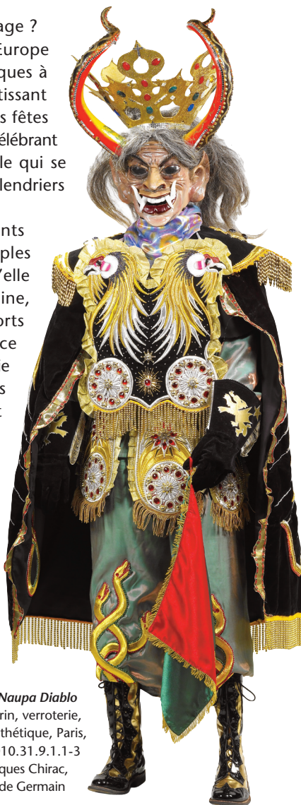
Costume de Naupa Diablo

Le carnaval fait partie de ces éléments culturels où s'expriment ces multiples aspects et facettes de l'identité, qu'elle soit caribéenne ou latino-américaine, marqués par une pluralité d'apports humains et culturels en provenance d'Europe, d'Afrique, d'Amérique, d'Asie ou même de la Caraïbe. Il n'est pas qu'une fête collective et un dévouement populaire, il est le lieu d'une revendication culturelle et identitaire, à la fois de l'individu et du groupe auquel il veut appartenir. Et le carnaval a aussi cette fonction de réhabiliter une culture ancestrale et traditionnelle qui avait pu être étouffée auparavant.