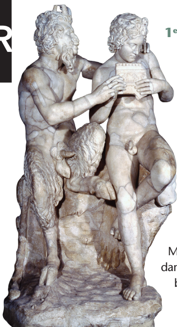
Pan et Daphnis

Copie romaine d'un original grec attribué à Héliodore (Eliodoro) Marbre. II e siècle avant notre ère Naples, Musée d'archéologie Nationale, 6329