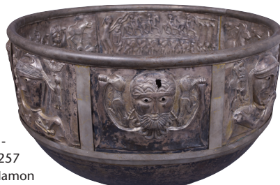
Copie du Chaudron de Gundestrup, Danemark

Certains anthropologues considèrent qu'une très ancienne religion préhistorique, commune à tous les peuples indo-européens, puisse expliquer ces parentés entre les pratiques et personnages carnavalesques de l'Europe occidentale et les mascarades déguisées des fêtes de l'Achoura en Afrique du Nord ou de Pourim dans le monde juif.