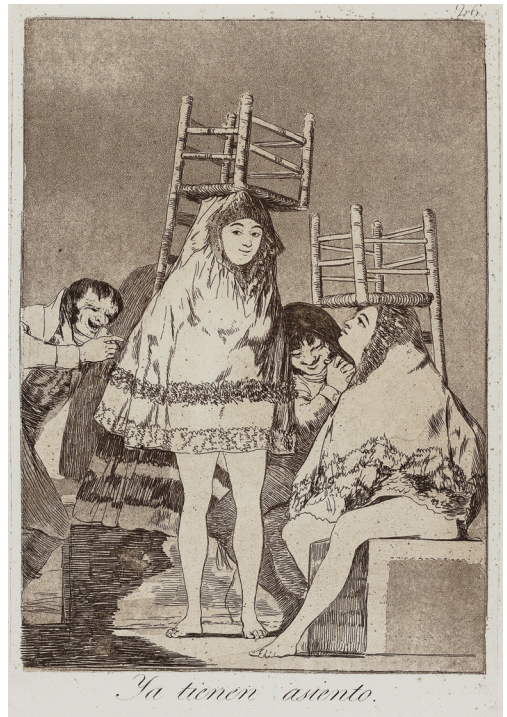
Les voilà bien assises, série "Les caprices"

de patrimoine culturel immatériel de l'humanité de l'Unesco comme le carnaval de Binche en Belgique qui a d'ailleurs inspiré l'artiste contemporain Pierre Alechinsky.