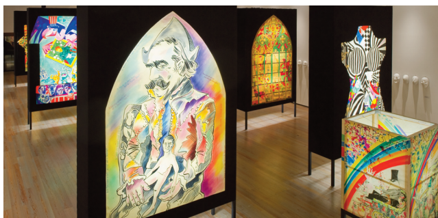
Lanterne au sujet Tinguely Roch(e)ade de la Fasnachtsgesellschaft Olympia

installation contemporaine réinvente la danse macabre à l'ère des algorithmes, évoquant un carnaval contemporain où les rôles s'inversent et l'humain vacille, dans une parade des vanités mêlant humour et effroi.