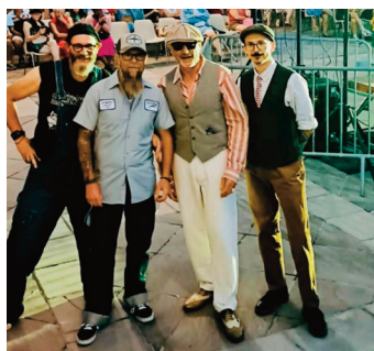
Harpyotime & The Cool Cats