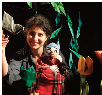
Compagnie La robe à l'envers