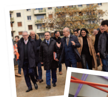
À La Valette-du-Var, en visite sur les chantiers des écoles