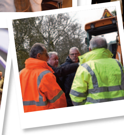
Visite de chantier sur la RD 17 au Thoronet